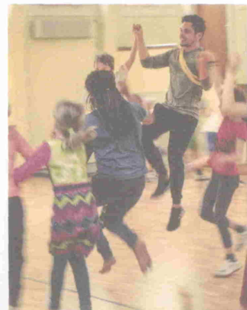
Rudolf Steiner Schule Zürich