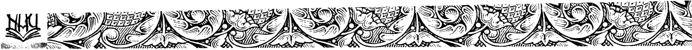
TABLE OF CONTENTS