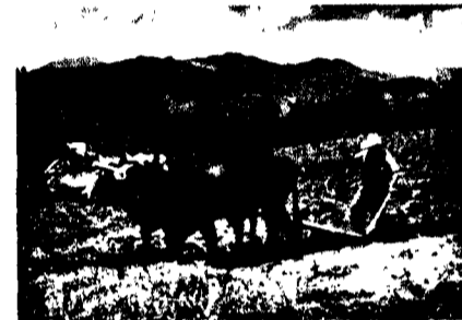
Campeño arando la tierra, El Pilguín, Francisco Morazán.