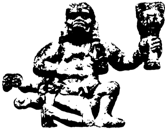
ESCALPURA DEL DIOS IK. DECORA LA TRIBUNA DE ESPECTADORES O PLATAFORMA DE REVISTA, SIRVE DE BASAMENTO AL TEMPLO N° 11. RUINAS DE COPÁN, HONDURAS