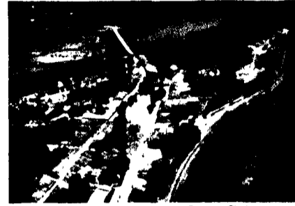
Vista aérea de la iglesia del municipio de Pespira, Choluteca.

Edificio Chiminike, segundo nivel, Bulevar Fuerzas Armadas de Honduras, Tegucigalpa, M.D.C., Honduras, C.A., PBX: 225-6630, 225-6628, 225-6632, Fax: 225-6633 www.edicionesramsés.hn