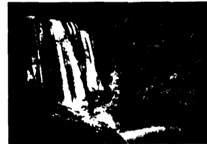
Catarata de Pulhapanzak, Cortés.