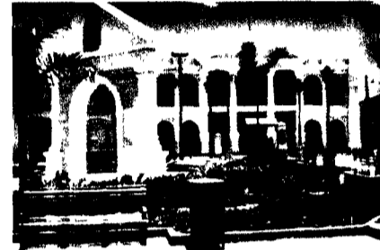
Edificio del Palacio Municipal de la ciudad de Comayagua.