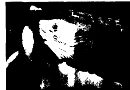
Guacamaya (Ara macao) residente en las Ruinas de Copán.