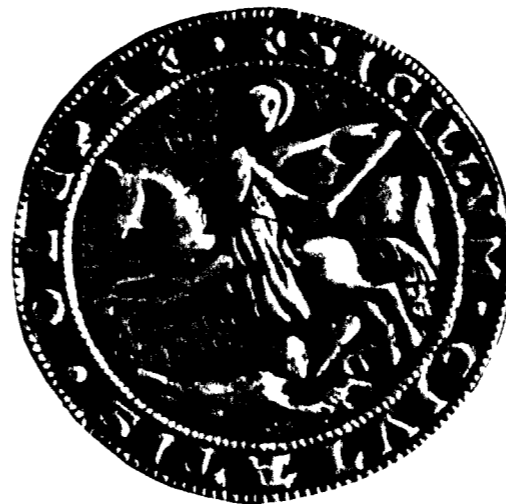
Stadtsiegel 1360 - Rekonstruktion